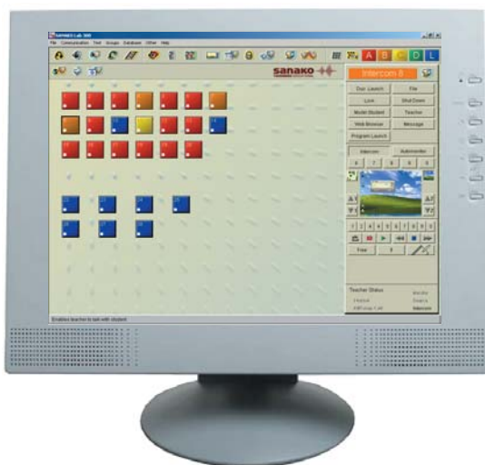
Программа Учителя SANAKO Lab 300

Sanako Lab 300 предлагает фантастические возможности для проведения интересных, эффективных уроков. Сочетание интерфейса студента - виртуального цифрового магнитофона Media Assistant Duo с возможностями управляющей Программы Учителя Lab 300 позволяет в полной мере использовать существующие медиа ресурсы. Lab 300 Media Assistant Duo имеет много важных и полностью интерактивных функций, включая оцифровку, сохранение в различных форматах, создание субтитров и установку закладок.