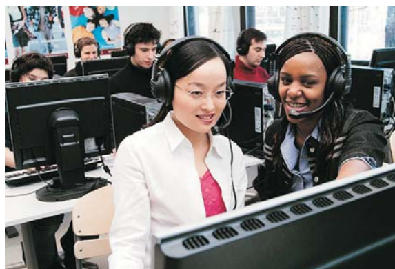
В SANAKO Lab 300 учителя полностью контролируют класс

В Lab 300 учитель может создавать компьютерную учебную среду и управлять ею. Lab 300 предлагает высококачественный аудио сигнал, видео, мультимедиа и позволяет использовать разнообразные учебные ресурсы.