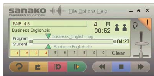
SANAKO Media Assistant Duo, Главное Окно

Спектр голоса (речи) двух дорожек - программы и студента, одновременно отображаемые в окне Media Assistant Duo, позволяют студентам сравнивать свои результаты с оригиналом и добиваться максимального сходства.